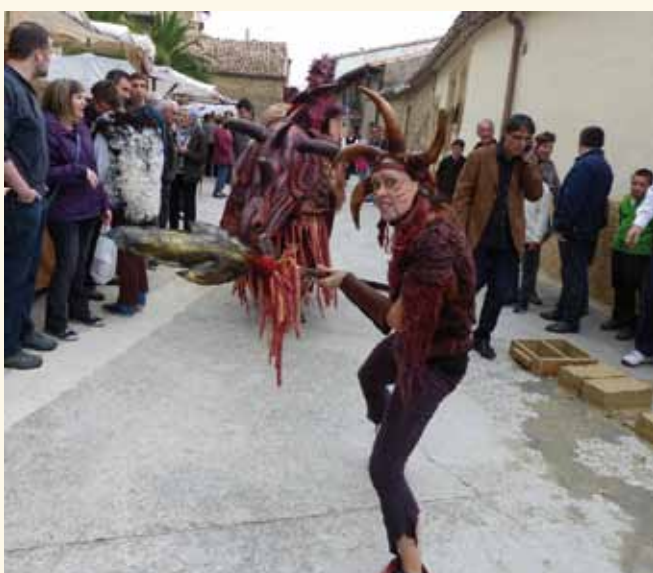
El grupo de animación