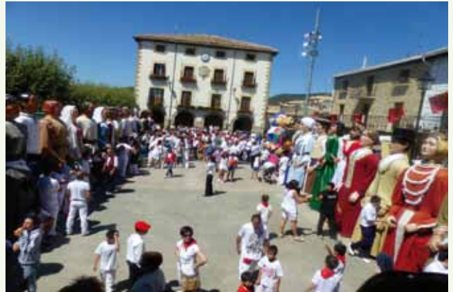
La gigantada con el Ayuntamiento de fondo

Para determinar el importe sobre el incremento del valor de los terrenos de naturaleza urbana se aplicará sobre el valor del terreno en el momento del devengo el porcentaje mínimo (Período de uno a cinco años: 2,2%; período