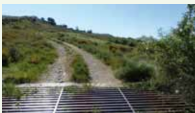
El Muladar municipal de Aibar

El Gobierno de Navarra ha legalizado el muladar de Aibar-Oibar y los ganaderos aibareses, que también podían constituir su propio muladar individual en alguna de las fincas de su propiedad, ya lo pueden utilizar sin problemas y sin coste alguno ya que el Gobierno de Navarra se encargará, a petición del Ayuntamiento de Aibar, de su gestión, control y mantenimiento.