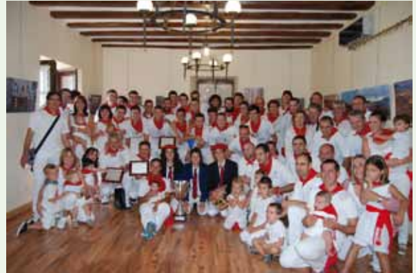
Los homenajeados, en el txupinazo

Las verbenas con orquestas espectaculares, los calderetes populares, la actuación de Benito Ros, las vaquillas, el kantuz, los bailes de disfraces, la cena popular, el día del niño y todas las actividades programadas hicieron que los aibareses viviesen unas fiestas participativas para el recuerdo.