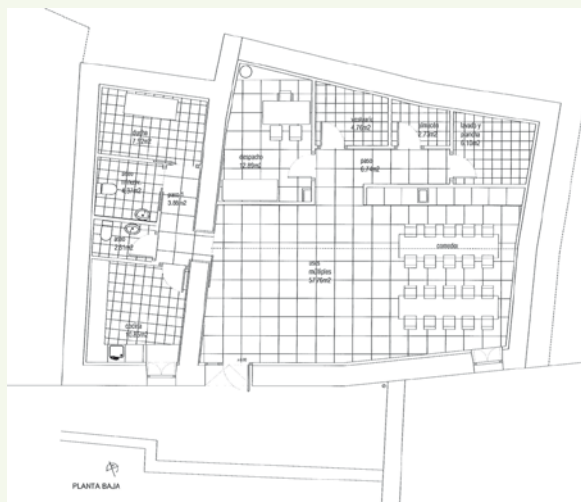
Éste es uno de los planos de distribución del CRAD