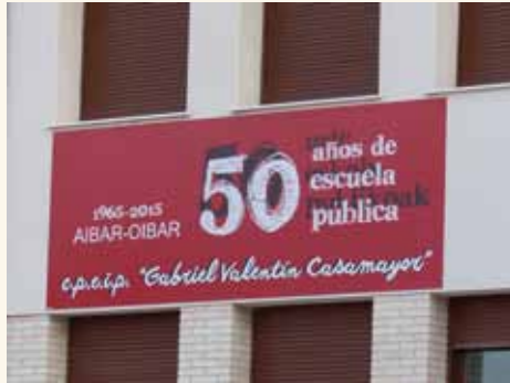
El colegio de Aibar recibió un premio el pasado curso de Ternera de Navarra.