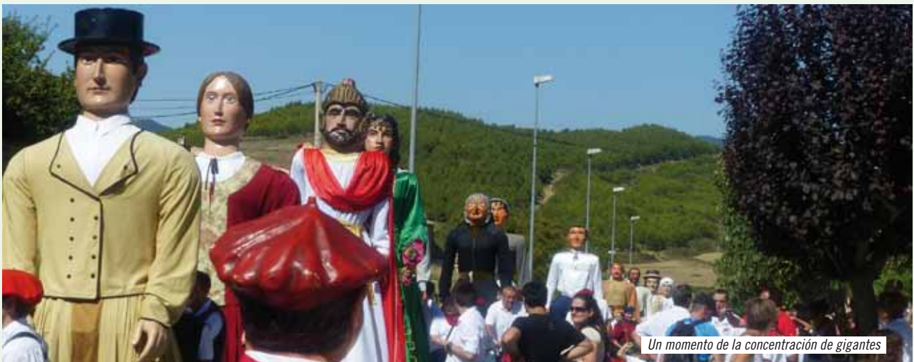
Un momento de la concentración de gigantes