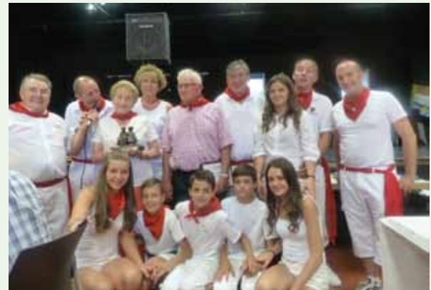
La familia Gumbre, en la comida popular de los jubilados