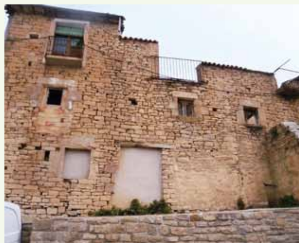
Éste es el edificio que se rehabilitará