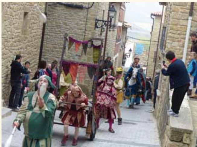
El desfile inaugural de los Medievales