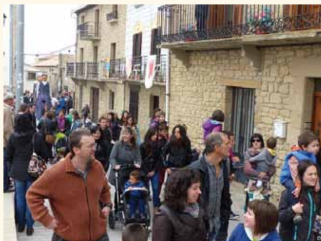
Los Gigantes en la plaza

Los XIII Medievales de Aibar-Oibar se celebraron el 1 de noviembre en una jornada con buen tiempo y numerosas actividades que alegraron y animaron la visita de centenares de visitantes y vecinos. El gran día vivido fue gracias a la decenas de voluntarios que de forma desinteresada hicieron posible el desarrollo de la fiesta.