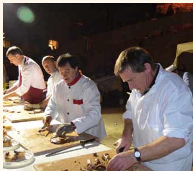
Los carniceros reparten el cuto