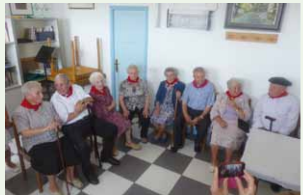
Los mayores de 90 años