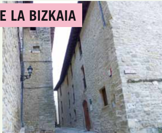
El albergue municipal La Bizkaia

El Ayuntamiento le incautó a Gardatxo S.L la garantía definitiva depositada por él por importe de 2.400 €, en tanto en cuanto se estima que la cuantía de los daños y perjuicios que puede sufrir este ayuntamiento derivados del incumplimiento culpable de las condiciones del contrato pueden ser iguales o superiores a esta. En todo caso, el día 31/05/2015, se procederá a la liquidación total del contrato, procediéndose, en su caso, a devolver el excedente.