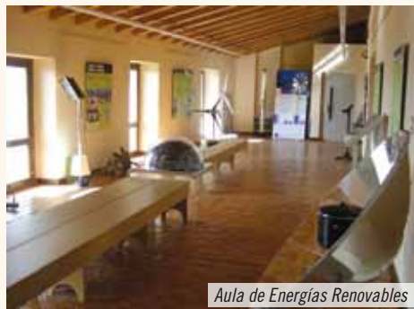
Aula de Energías Renovables

Tras unos meses en los que ha permanecido cerrada, el Aula de las Energías Renovables de Aibar-Oibar ha retomado de nuevo su actividad.