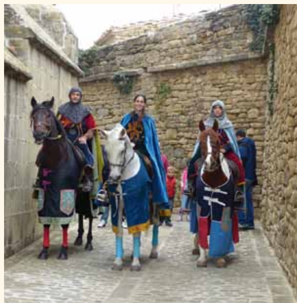
Junto a la Iglesia

Los XIII Medievales de Aibar-Oibar sirvieron para demostrar el arraigo de esta fiesta en nuestra localidad. El desfile inaugural con el grupo de animación, los caballos medievales, la comparsa de gigantes Auzolan, los txistularis, la banda y los vecinos que se vistieron de época medieval contribuyeron a dar más realce al inicio de la gran jornada festiva vivida en Aibar. La novedosa doma de caballos, los diferentes puestos de artesanos y talleres, el tiro con arco, el esquileo con el internacional Melquiades, la exhibición de rapaces, la txalaparta, las flores, los juegos infantiles, el Museo Casa de Aibar, la exposición de los cuadros ganadores de todos los concursos de pintura Pintor Crispín, la exhibición de fabricación de sogas, el pisado de la uva, las visitas guiadas, la explicación, visita y muestra audiovisual del extraordinario patrimonio de la iglesia de San Pedro y Santa María y los cantos de la Coral y las Jotas de Ronda y la txaranga, así como la degustación gratuita de cuto y vino en una plaza casi llena de personas contribuyeron al buen desarrollo de la jornada festiva.