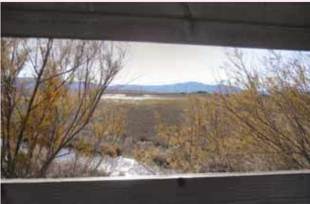
Una vista de La Mueda

La balsa de la Mueda de Aibar-Oibar será restaurada el próximo año. El Servicio de Conservación de la Biodiversidad del Gobierno de Navarra ha realizado una ficha-Proyecto de la restauración del Humedal de la Mueda y la ha remitido a la Fundación la Caixa para su aprobación y financiación.